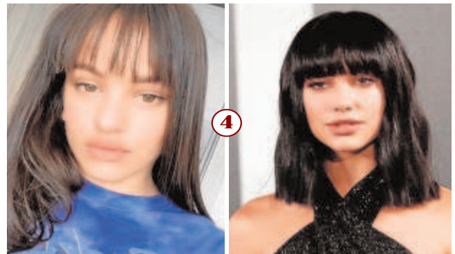
Rosalía y Dua Lipa