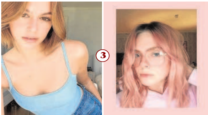
PIXIES (Y MELENAS) DE COLORES. Kaia Gerber y Elle Fanning