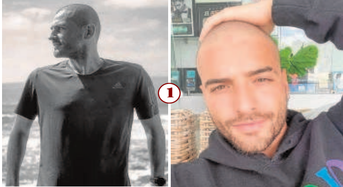
RAPADOS. Íker Casillas y el colombiano Maluma